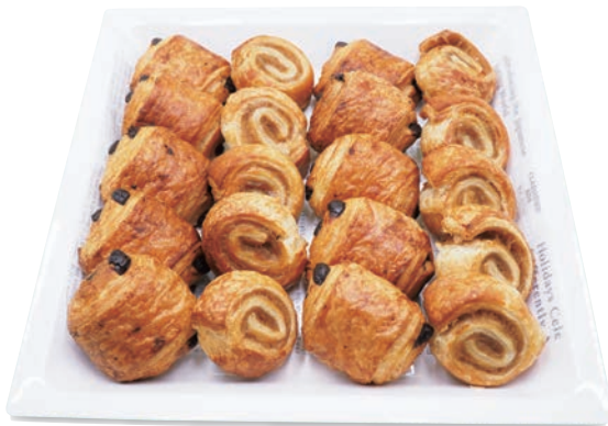
ペストリー 2,200円 (税抜2,000円)