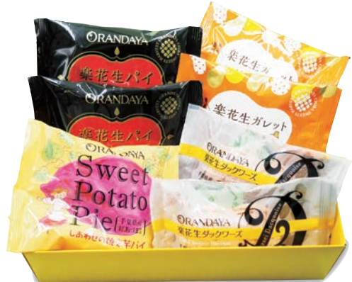
千葉銘菓 (洋菓子) 1,430円 (税抜1,300円)