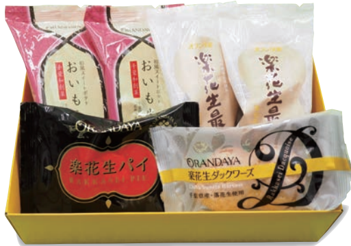
千葉銘菓 (和菓子) 1,430円 (税抜1,300円)