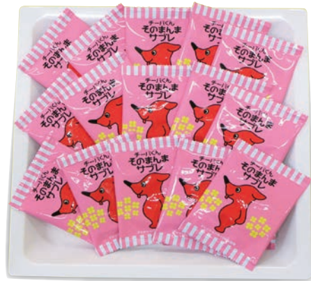
チーバくんそのまんまサブレ 1,650円 (税抜1,500円)