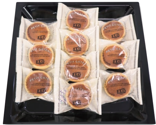
季節のプティタルト 2,750円 (税抜2,500円)