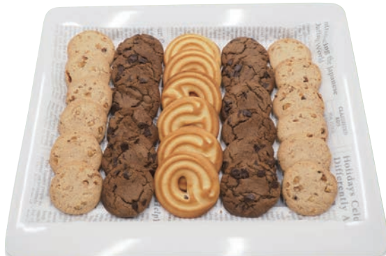
クッキー 1,100円 (税抜1,000円)