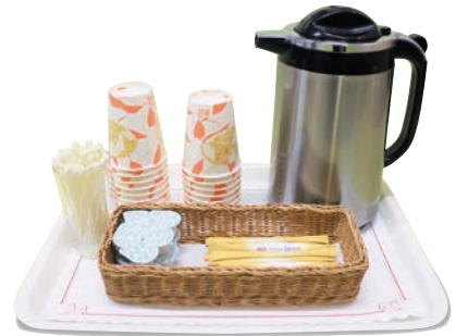
セルフサービス (紙コップ)