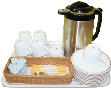
セルフサービス (カップ&ソーサー)