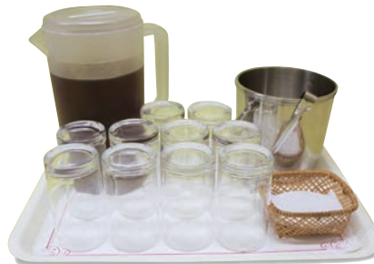
セルフサービス (グラス)