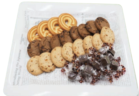
クッキー&チョコ 1,100円 (税抜1,000円)