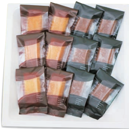
フィナンシェ 3,300円 (税抜3,000円)